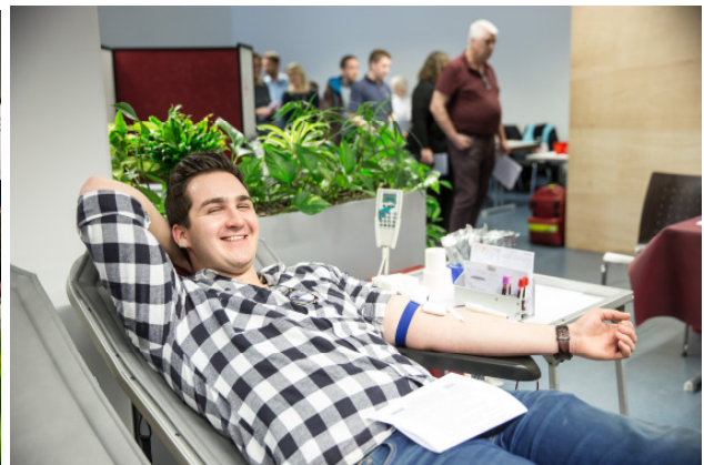
Bildunterschrift: Dieser Einsatz macht glücklich - Krones-Mitarbeiter engagieren sich gern für ihre Mitmenschen.